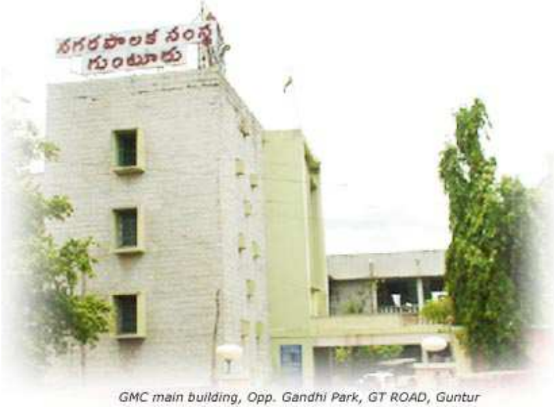
GMC main building, Opp. Gandhi Park, GT ROAD, Guntur